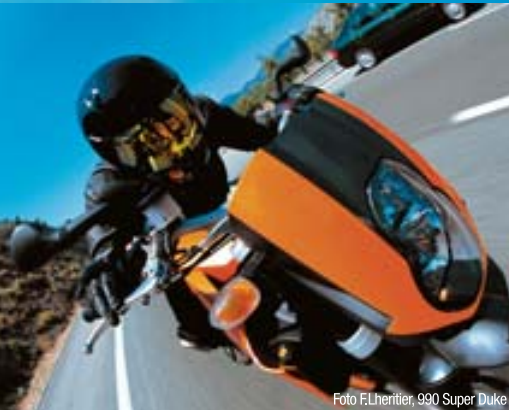
990 Super Duke